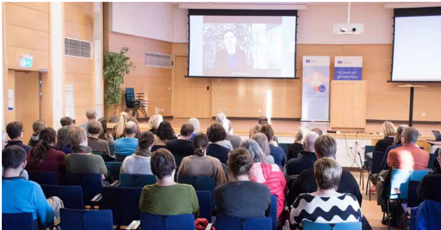
Medarbetare från Region Västerbotten tar del av direktsändningen i Regionens hus i Umeå.